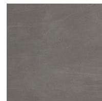
grau · grey