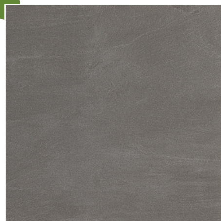
60 × 60/2 cm Y-TSN 241E GRAU · GREY