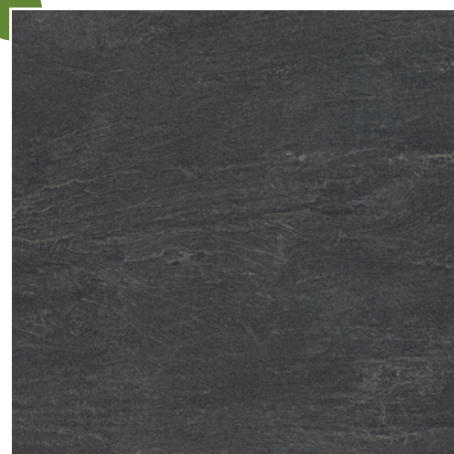
60 × 60/2 cm Y-TSN 245E GRAPHIT · GRAPHITE